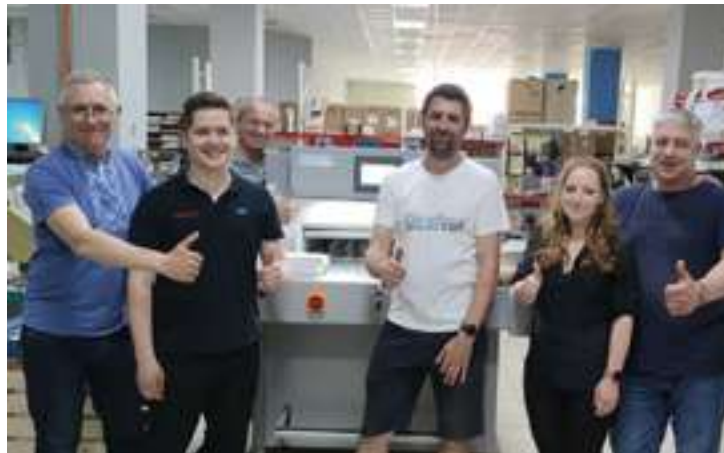
Колектив компанії «Тотем» біля гільотини Grafcut G73H