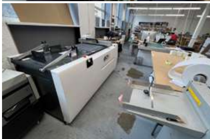
iEcho PK-0705 Plus в одній з друкарень м. Рига