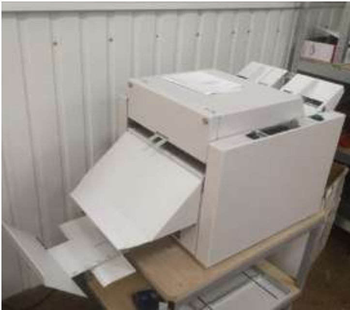
Моргана VM 60 у друкарні «Глянець»