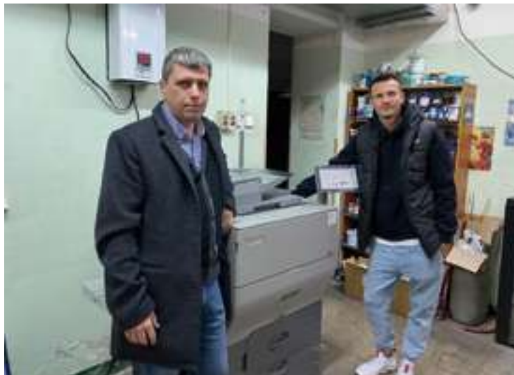
ЦДМ Ricoh™ Pro C5300S інстальовано у вересні в одній з київських друкарень

Ricoh перебуває у центрі екосистеми «Мегатрейд» й вирішивши питання дистрибуції продуктів компанії на нових