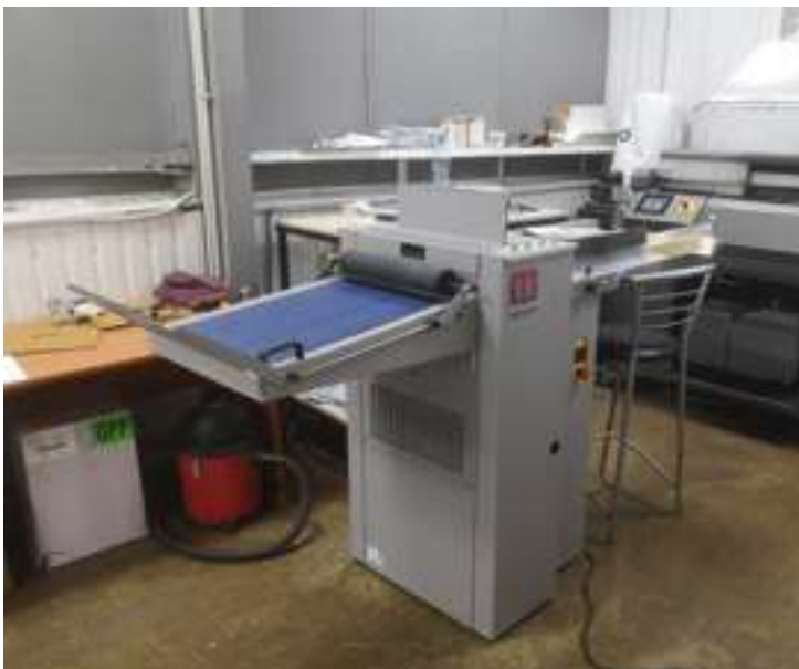
Моргана Digifold Pro у компанії «Глянець»