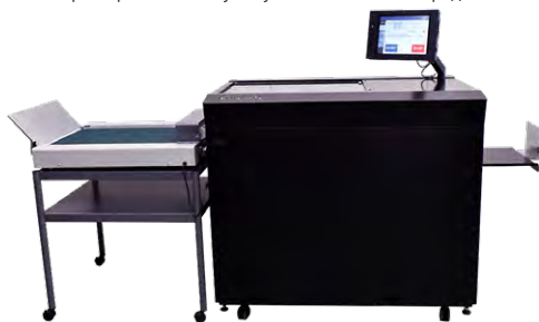
AeroCut X Pro Complete Package

*Норми виробництва базуються на оптимальних робочих умовах і можуть змінюватися залежно від запасів та умов навколишнього середовища. *В рамках нашої програми безперервного поліпшення якості продукції, технічні характеристики можуть бути змінені без попереднього повідомлення.